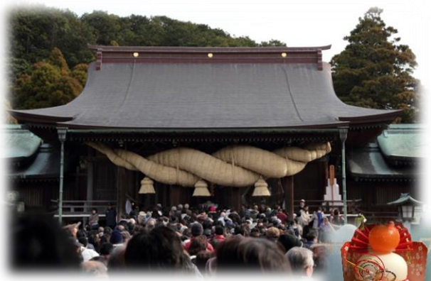
1月5日宮地岳神社へ 初詣に行きました!!